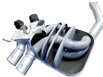
Carcasas de silenciador