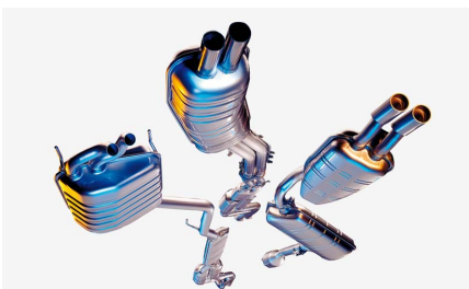
Sistema de escape